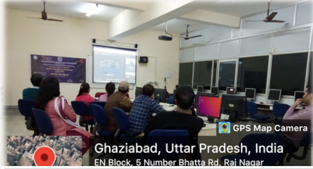
Ghaziabad, Uttar Pradesh, India EN Block, 5 Number Bhatta Rd, Raj Nagar

Faculty Development Programme on "Planning, Execution, and Evaluation of Project Work" in association with NITTTR, Chandigarh