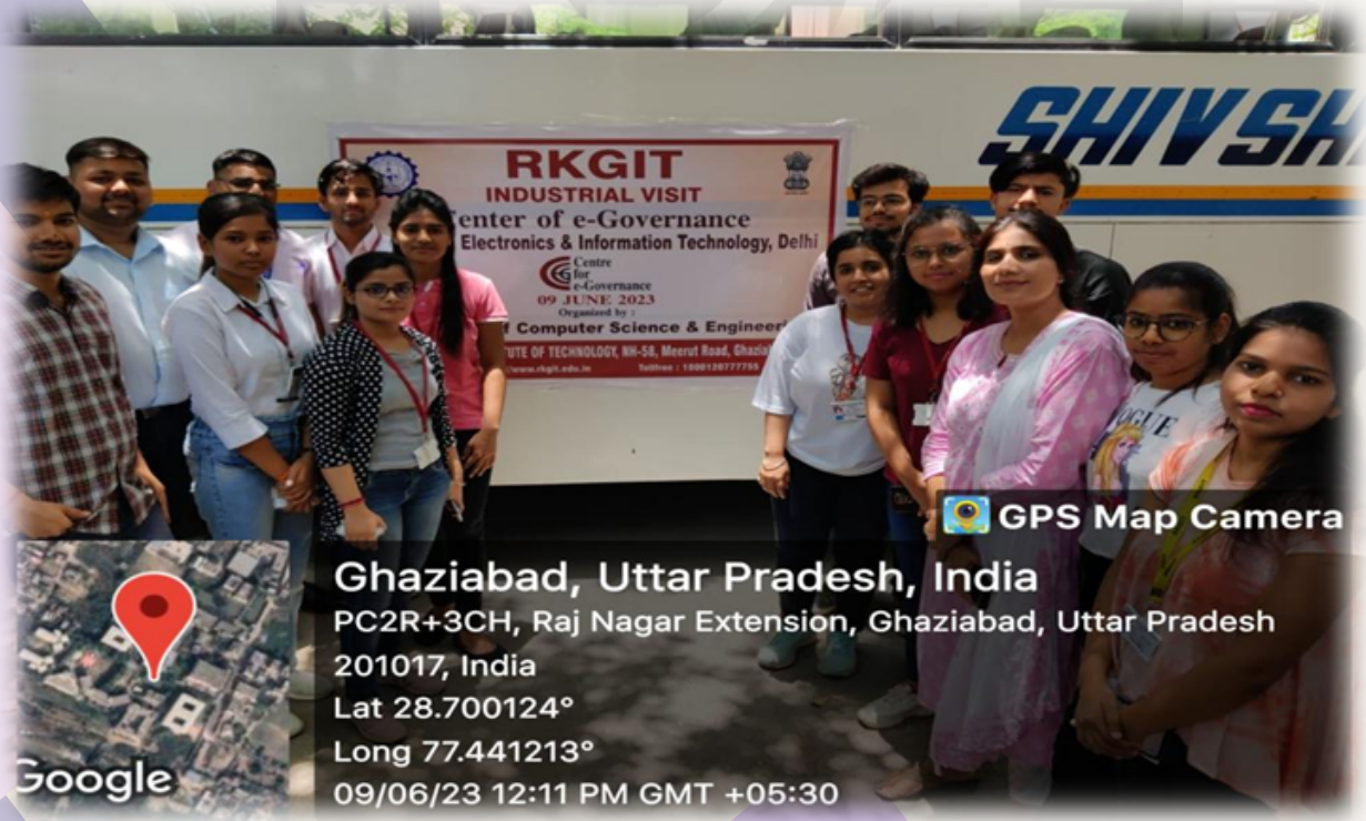
Industrial Tour at CeG, Electronics Niketan, 6 CGO Complex, New Delhi. (Dated : 09-06-2023)