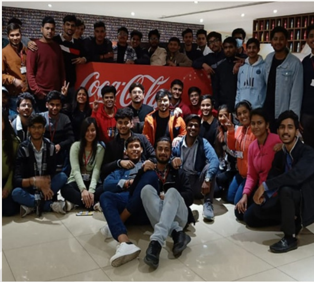
Industrial Visit at Coca-Cola (Dated : 21-01-2023)